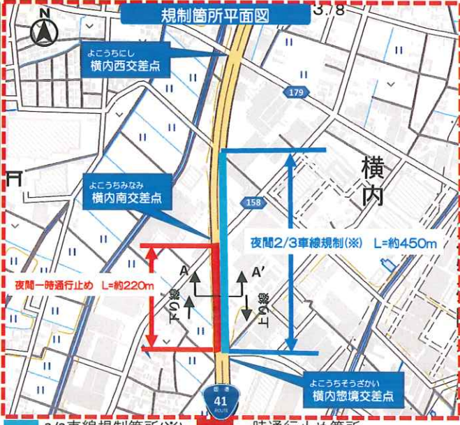
(国土地理院標準地図に地名、範囲を加工掲載) 2/3車線規制箇所(※) 一時通行止め箇所